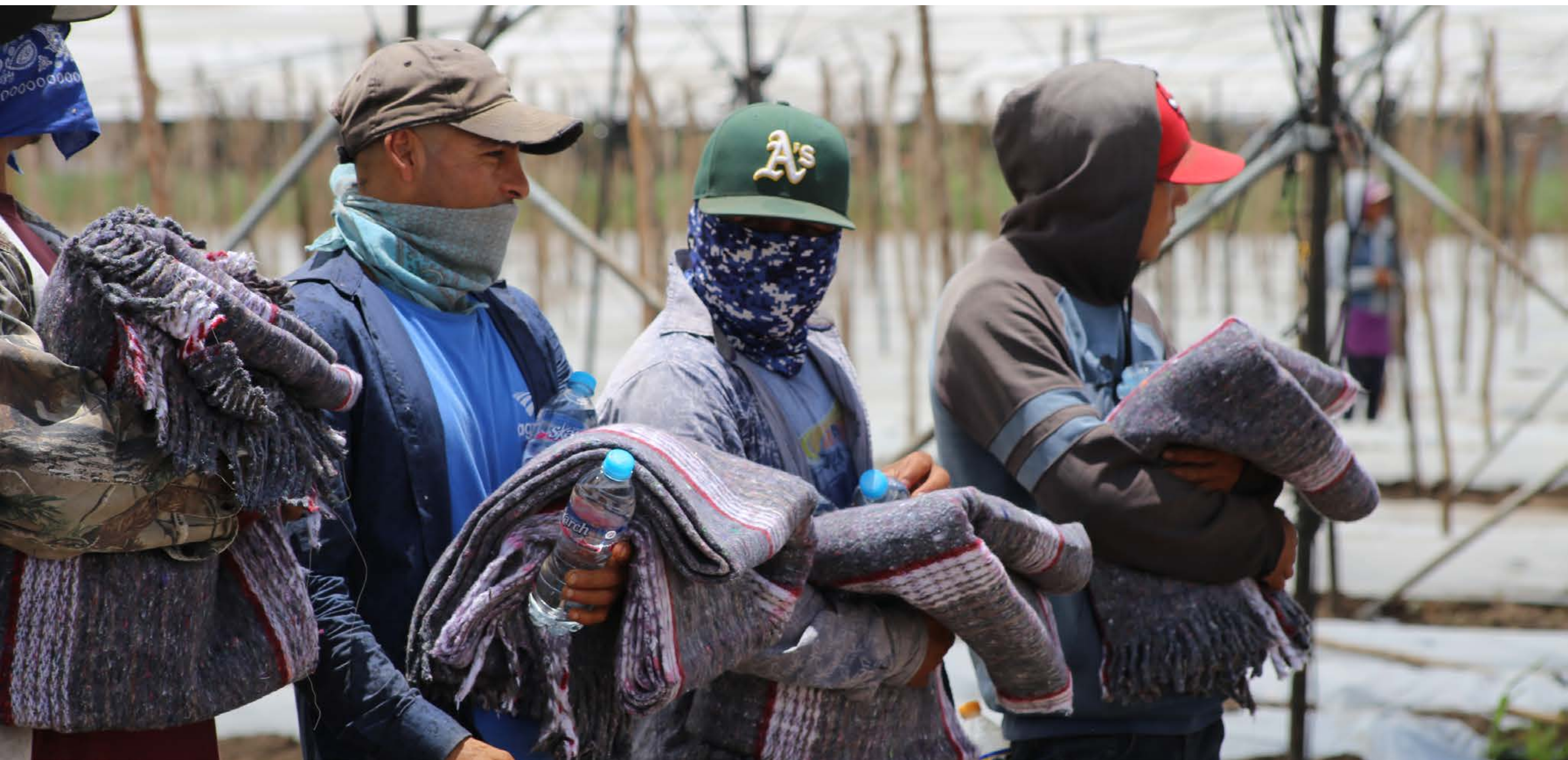
Personas Migrantes no pasarán frío gracias al apoyo humanitario

Además, acudimos a las empresas que emplean a personas jornaleras agrícolas y entregamos 1 mil 215 despensas integrales alimentarias, 2 mil cobijas, 3 mil botellas de agua, 500 kits de primeros auxilios y 900 colchonetes. Estos centros de trabajo se ubican en los municipios de Dolores Hidalgo Cuna de la Independencia Nacional, Guanajuato, León, Romita, San Diego de la Unión, San Felipe, San Francisco del Rincón, San José Iturbide, San Luis de la Paz y Silao de la Victoria.