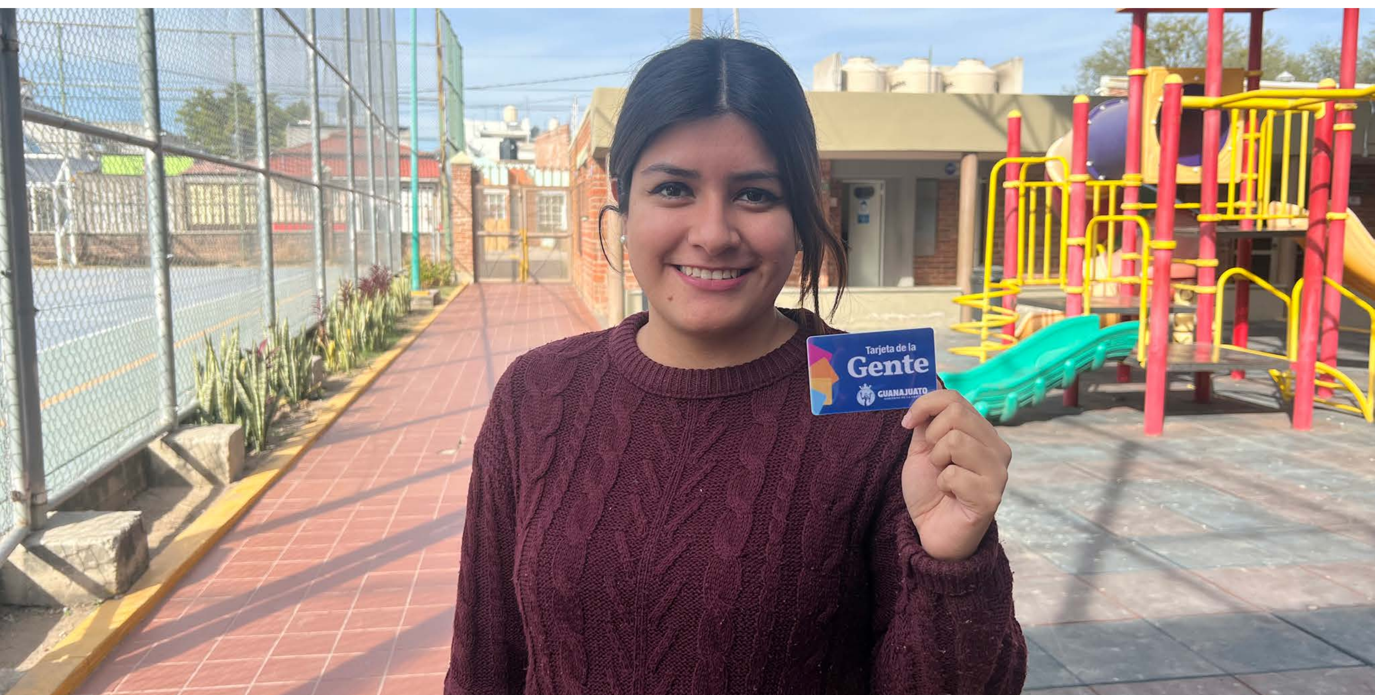
Tarjeta de la Gente

Dejamos huella en nuestra gente. Con la Tarjeta de la Gente, otorgamos beneficios a la población, favorecemos el comercio local y brindamos a 92 mil 756 personas la oportunidad de disfrutar de descuentos en 1 mil 357 establecimientos. Además, facilitamos acceso a los servicios gubernamentales, pero, lo más importante, mejoramos la calidad de vida de las familias guanajuatenses.