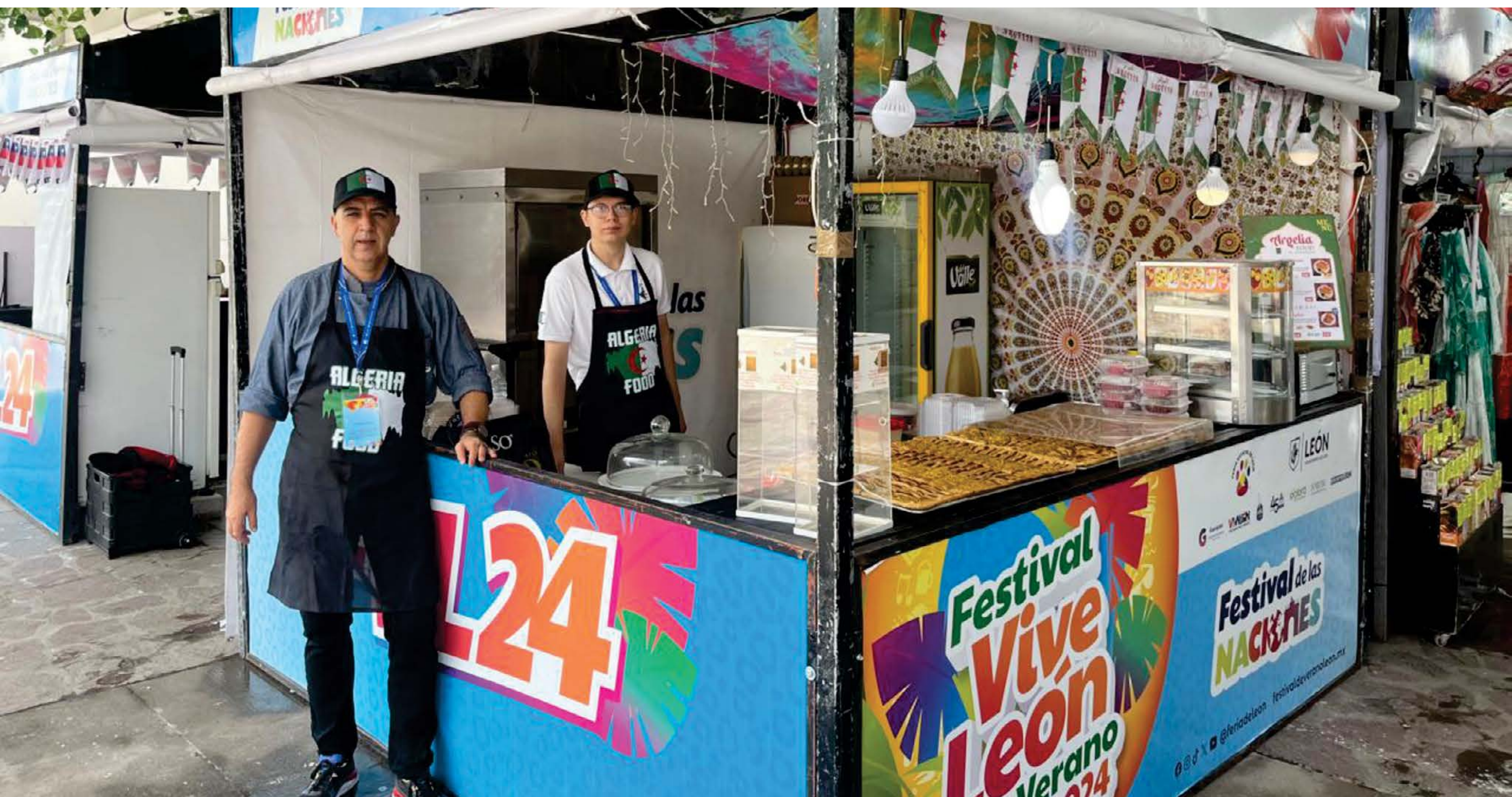
La comunidad de Argelia se hace presente en el Festival Vive León

Estas actividades favorecen la integración social y económica de las comunidades internacionales en la dinámica local. Al generar estos espacios de convivencia, se beneficia a las y los guanajuatenses con la promoción de un entorno más inclusivo y diverso.