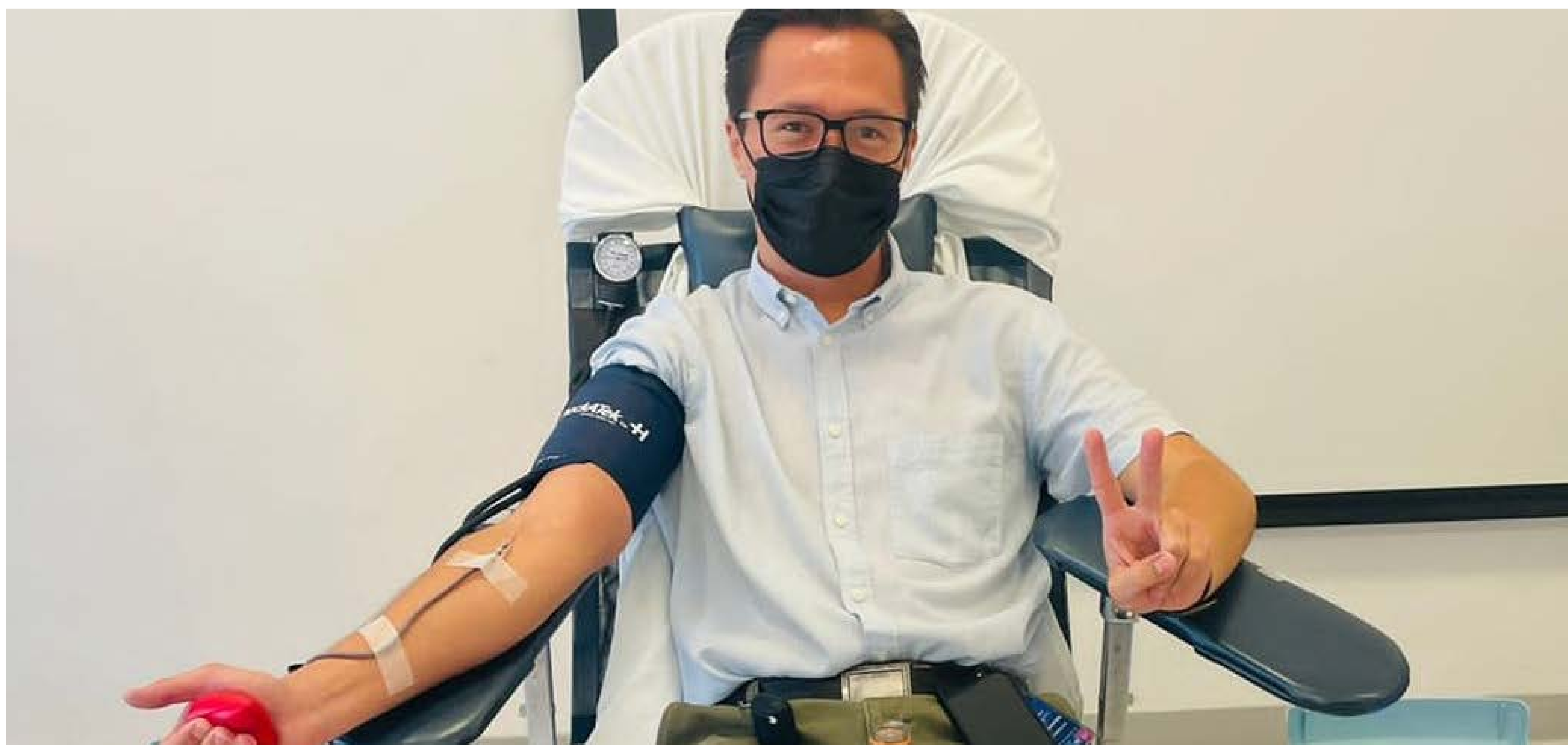
Campañas de donación de sangre

Además, se promueve y supervisa la captación de sangre segura en todo el estado, gracias a la labor altruista de 2 mil 419 donantes. En 2024 captamos 38 mil 99 unidades, a través de 81 campañas de promoción para beneficio de 6 mil 47 pacientes que se atienden en las unidades médicas del Isapeg.