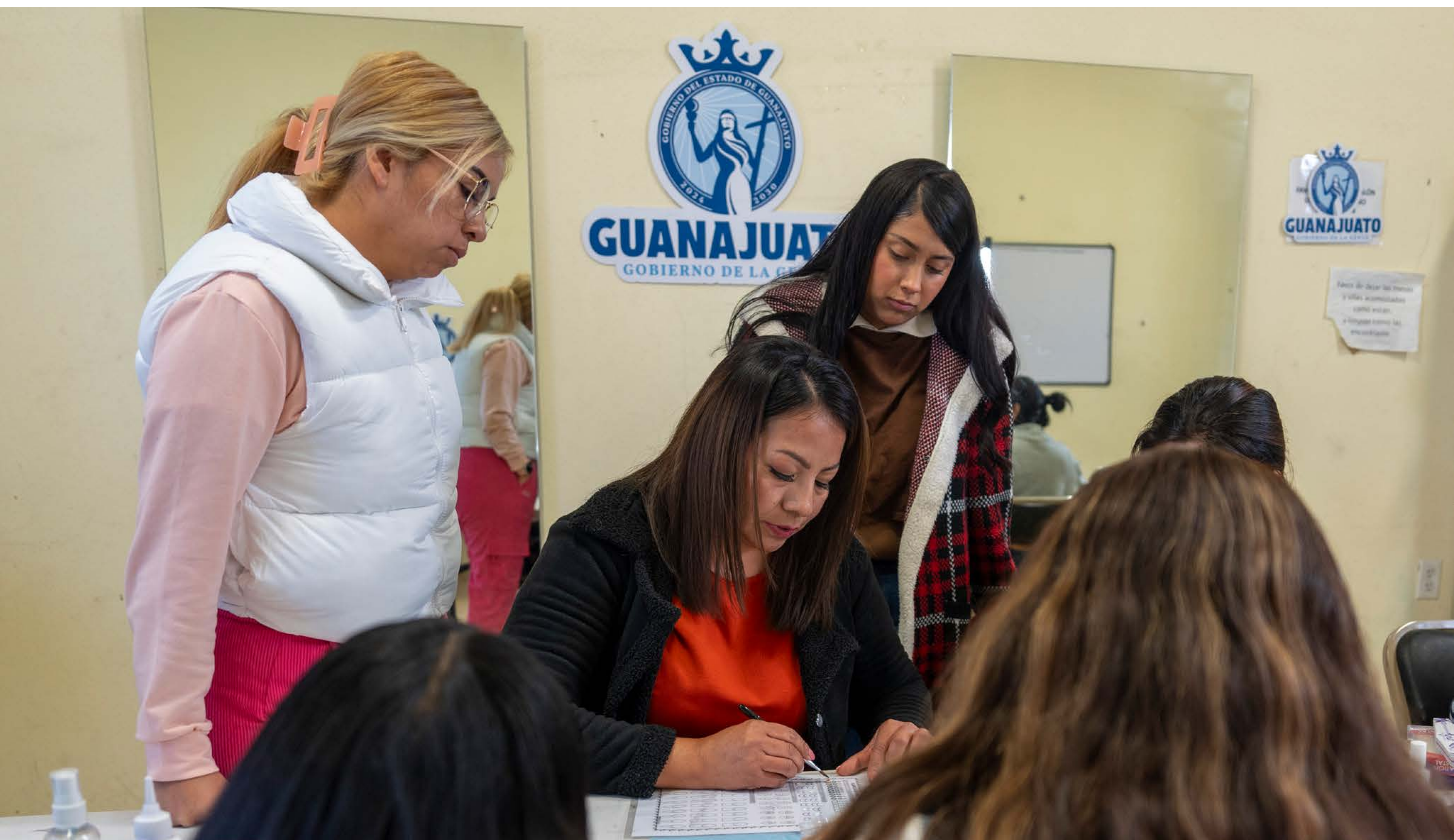
Capacitación de mujeres

Cuidamos de nuestra gente para un futuro mejor. Trabajamos para que el acoso en la vía pública se considere una falta administrativa sancionable en 16 municipios y 10 más están en proceso de incorporar esta sanción, para generar espacios libres de violencia.