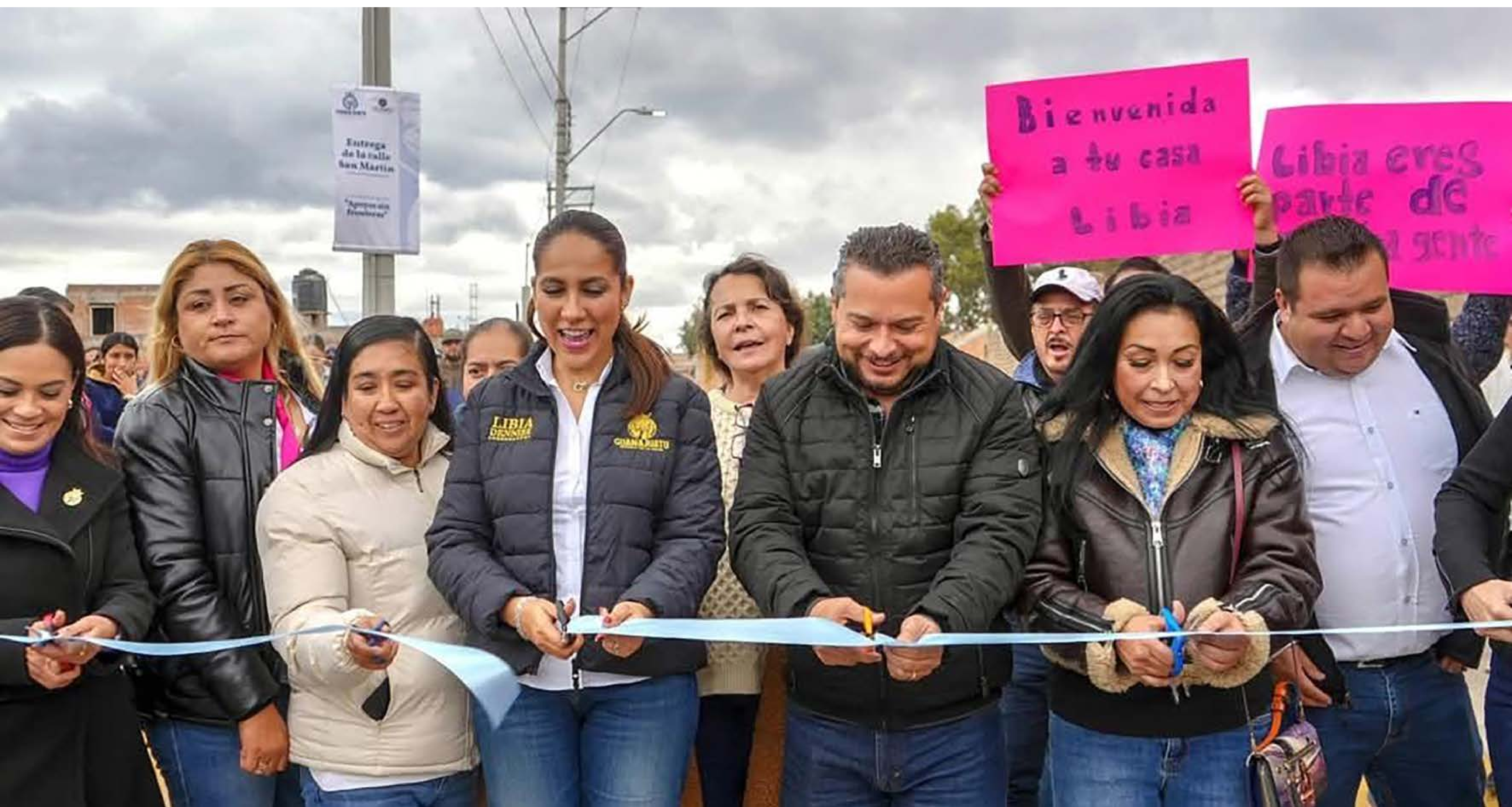
Inauguración de obra por la gobernadora de la gente en Ocampo, Gto.

Estas acciones transformaron los espacios donde viven sus familias. Cada proyecto refleja la dedicación de las personas migrantes para mejorar la calidad de vida de 4 mil personas y colaborar para un entorno más seguro y digno.