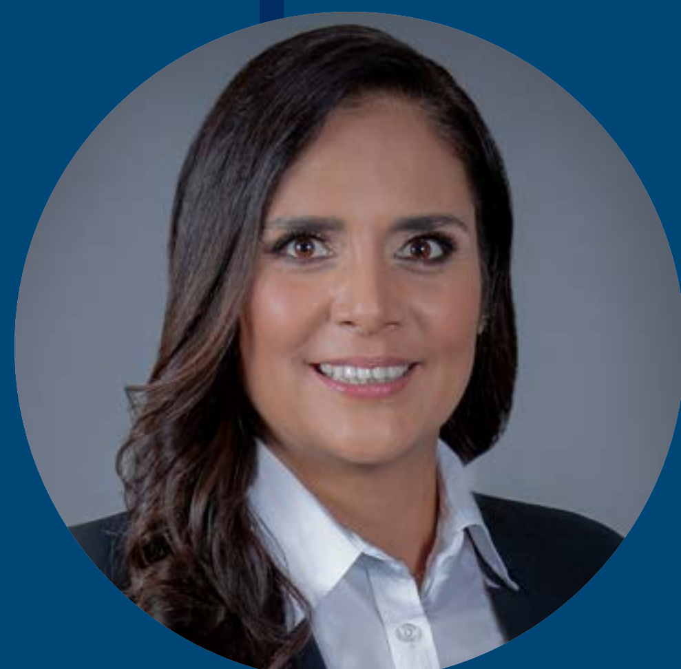
Yendy Cortinas López Comisión del Deporte del Estado de Guanajuato