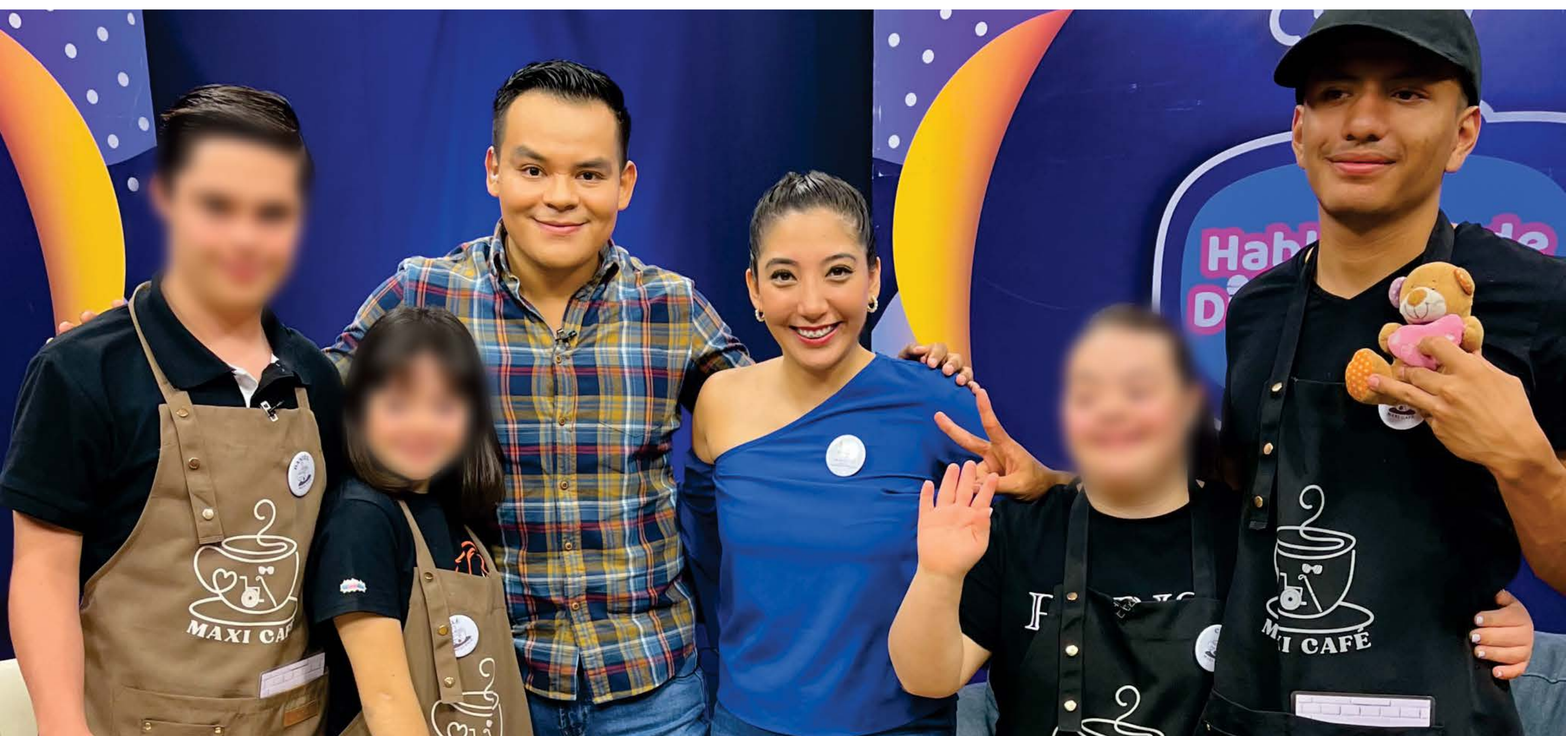
Se llevaron a cabo 132 transmisiones con 265 participantes

En el Gobierno de la Gente la dignidad humana es una prioridad. Tener un trabajo es fundamental para la independencia, autonomía y autoestima de todas y todos, por esto, se realizaron 786 acciones para fomentar la inclusión laboral de las personas con discapacidad que incluyeron: 166 capacitaciones dirigidas a equipos de trabajo.