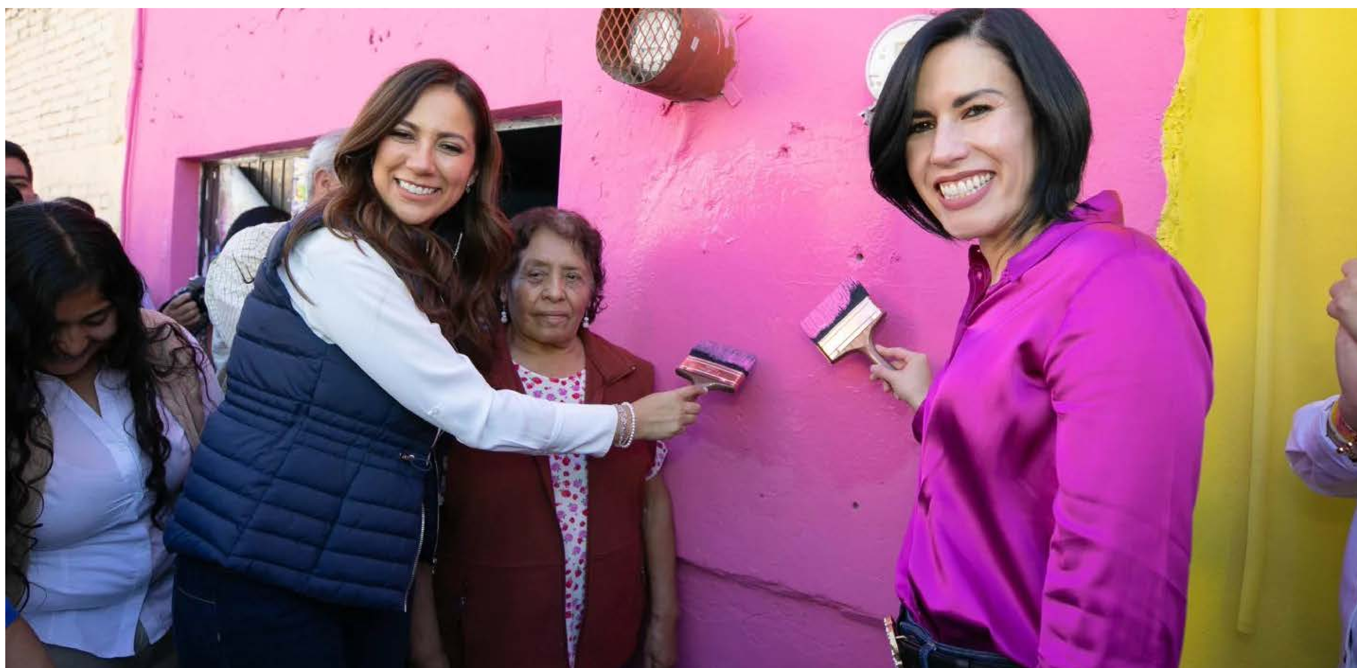
Cambiamos el aspecto de las colonias y comunidades para crear y reforzar el sentido de pertenencia

Este gobierno somos todas y todos. Promovemos que la gente cambie el aspecto de sus colonias para crear y reforzar un sentido de pertenencia. Con la renovación de más de 11 mil 671 fachadas, beneficiamos a 11 mil 589 hogares. Ver las colonias y comunidades llenas de color en las mejores condiciones motiva a las personas a cuidar nuestros espacios, además de que mejora su imagen.