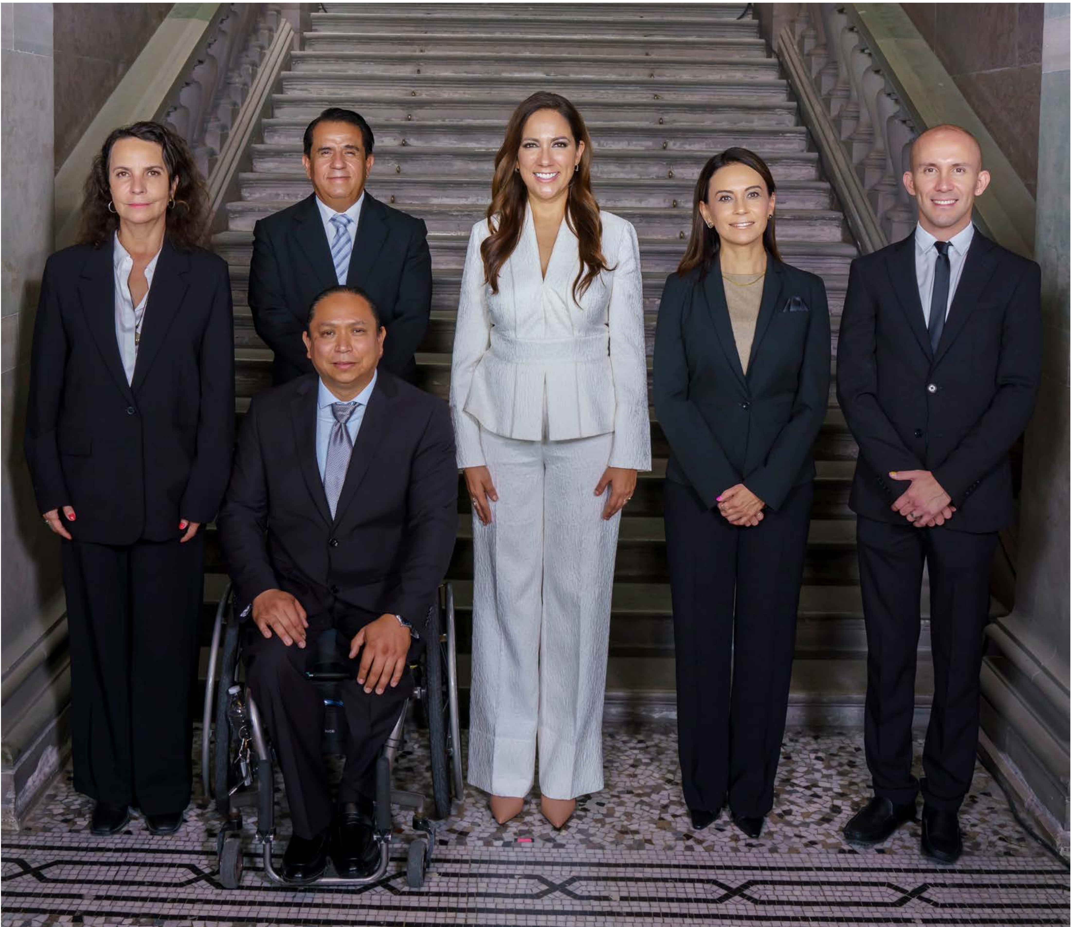
Equipo de la Secretaría de Derechos Humanos

Realizamos 49 acciones en favor de grupos en situación de vulnerabilidad que beneficiaron a más de 650 mil personas como parte del primer Programa Estatal de Derechos Humanos.