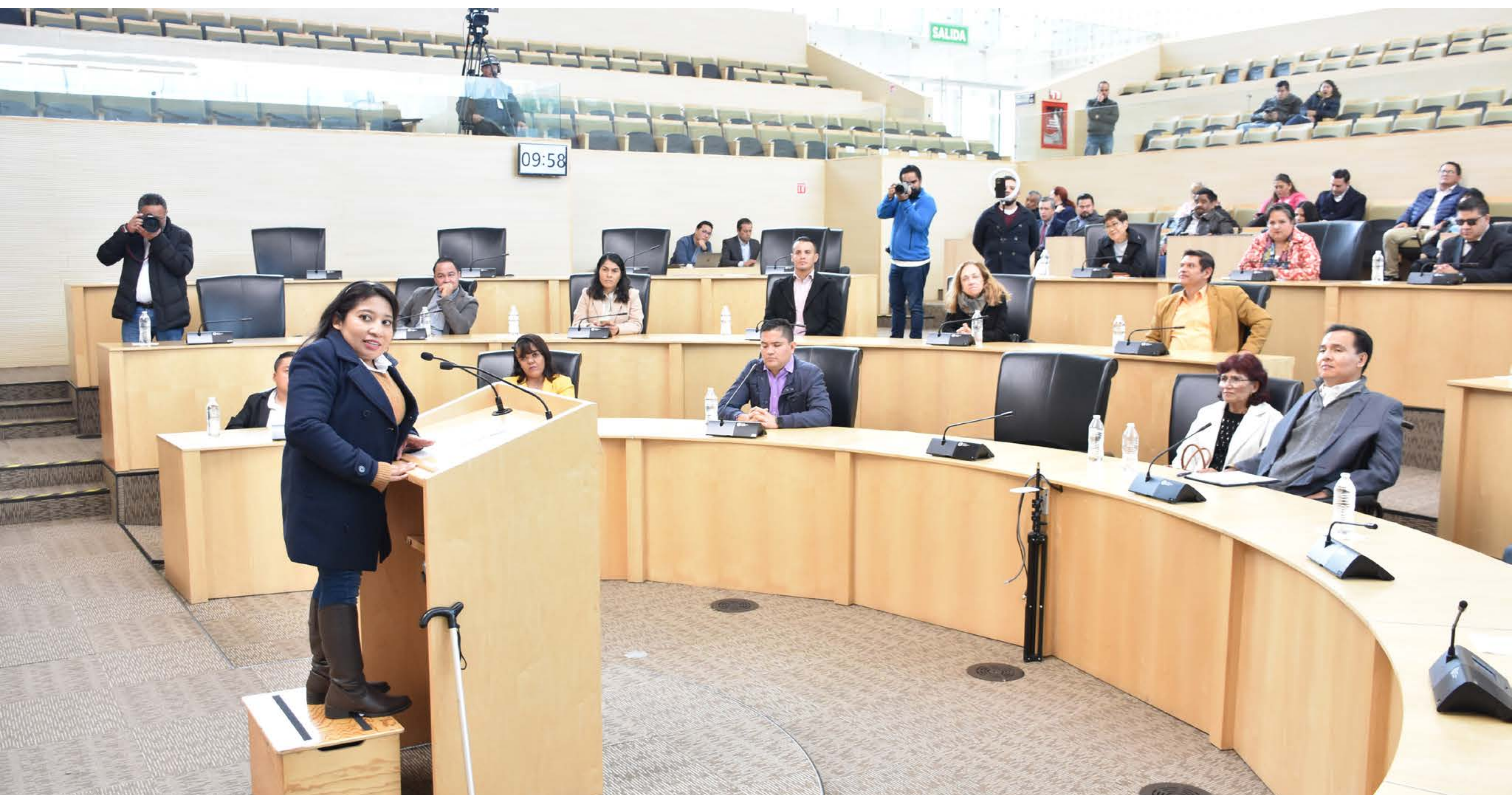
Que personas con discapacidad estén presentes en el Congreso del Estado, mediante consultas ciudadanas

185 estudiantes universitarios de áreas como Terapia Física y Oftalmología, realizaron su servicio social profesional en la rehabilitación de personas con discapacidad, lo que permitió ampliar la cobertura de atención en servicios.