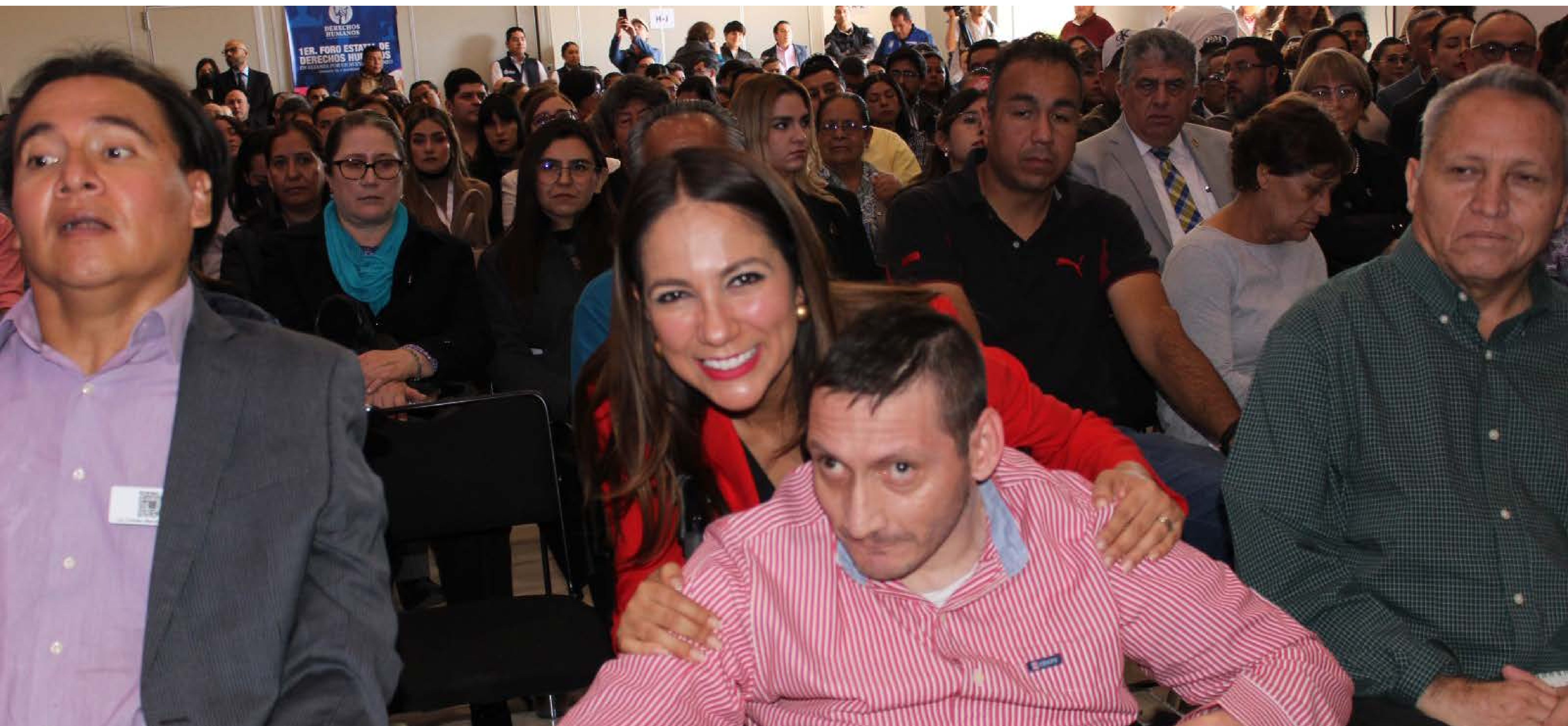
La Gobernadora de la Gente pudo conocer las necesidades de los cuatro grupos vulnerables que atiende la Secretaría de Derechos Humanos

Con el Foro Estatal de Derechos Humanos, integramos a la academia, autoridades gubernamentales municipales, estatales y federales, organismos internacionales, organizaciones de la sociedad civil y la iniciativa privada para compartir conocimientos y experiencias que permiten promover mejores políticas públicas en materia de migración, discapacidad, personas indígenas, afromexicanas y de la diversidad sexual y de género.