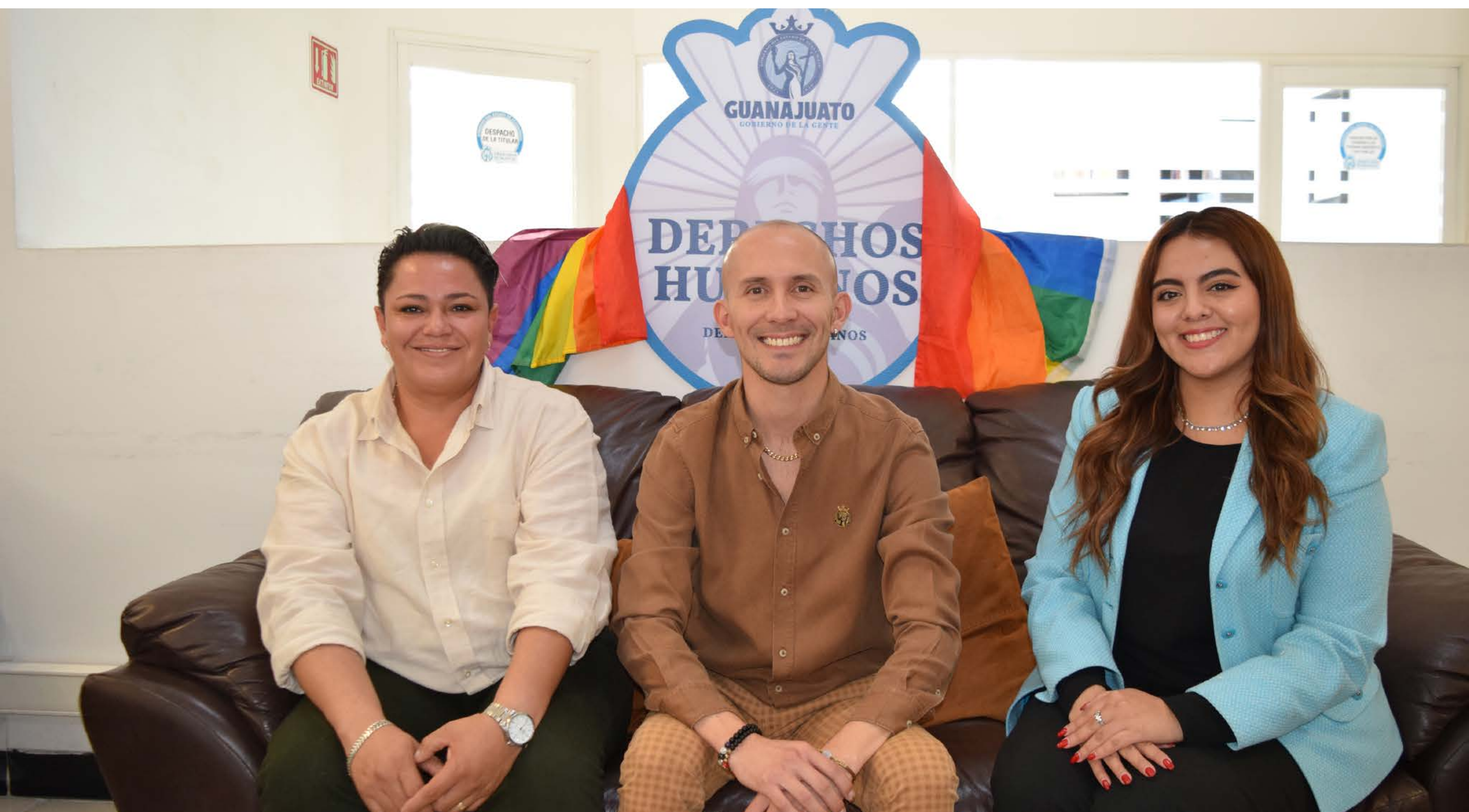
El municipio de San Francisco del Rincón atendiendo a la comunidad LGBTI+

Capacitamos tanto a los 46 municipios para la creación de las Unidades Municipales y de Atención a la Diversidad Sexual y de Género, como a 21 empresas de la iniciativa privada para favorecer políticas de inclusión laboral.