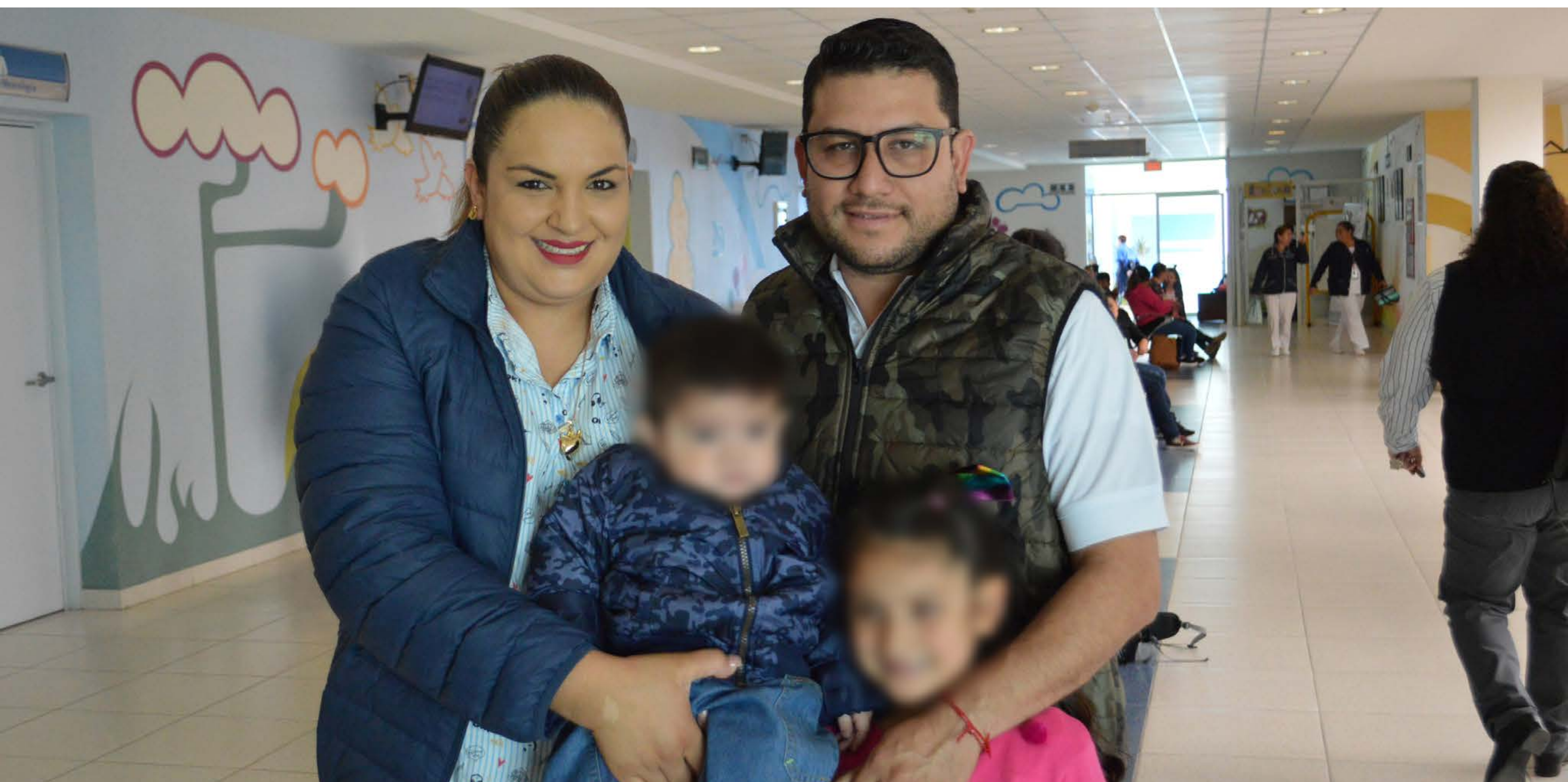
Orientamos a madres, padres y/o tutores en datos de alarma para cáncer infantil

Trabajamos en concientizar a la población para identificar signos de alarma de riesgo suicida.