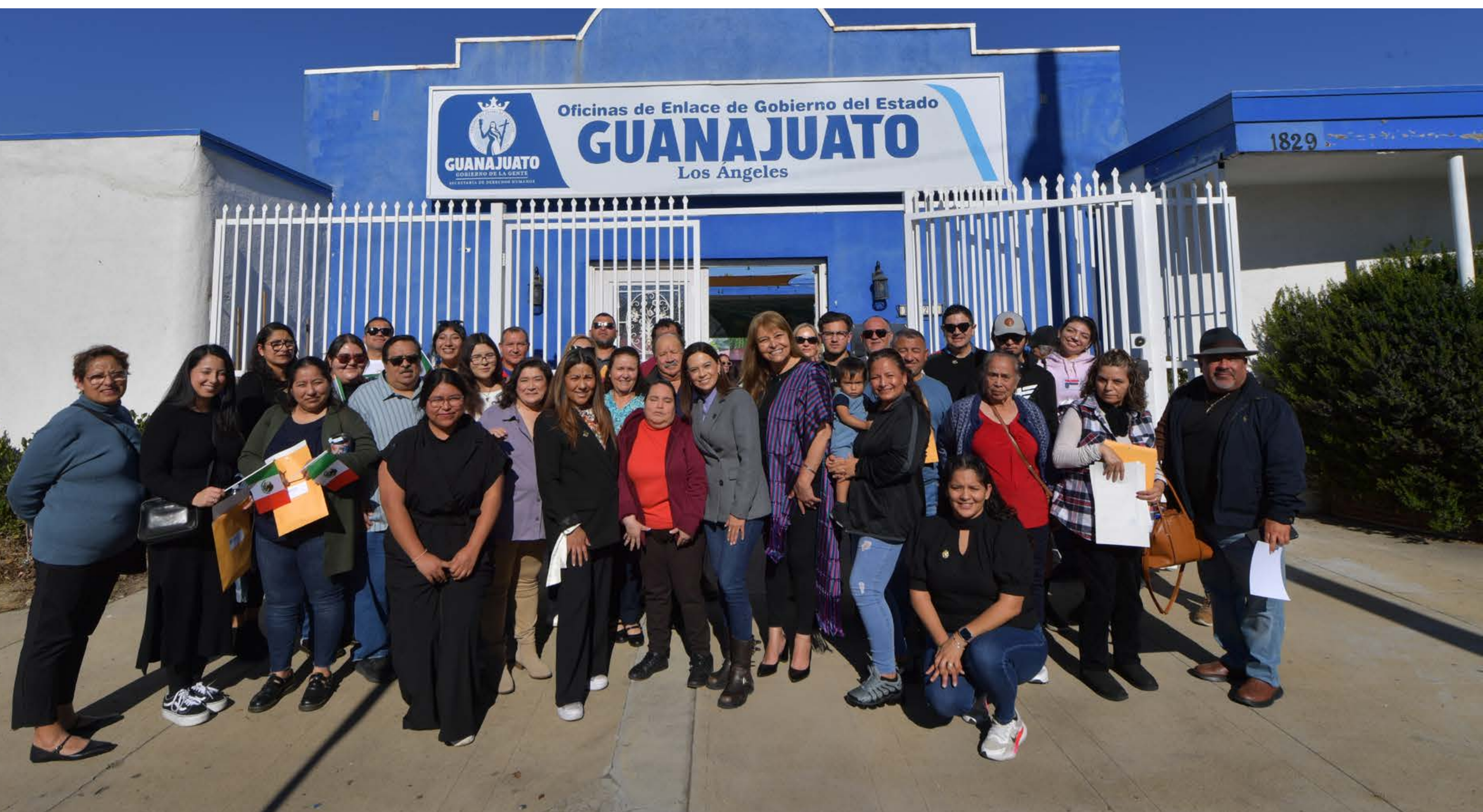
En las Oficinas Enlace los migrantes encuentran el apoyo necesario para su vida en Estados Unidos de América

Cuando se trata de ayudar, traspasamos fronteras. A través de tres ferias de servicios en la Unión Americana, facilitamos el acceso a documentos de identidad, oportunidades de educación a distancia y diversos apoyos. Estos esfuerzos ayudan a estrechar lazos con personas migrantes para que, a pesar de la distancia, sientan un gobierno cercano.