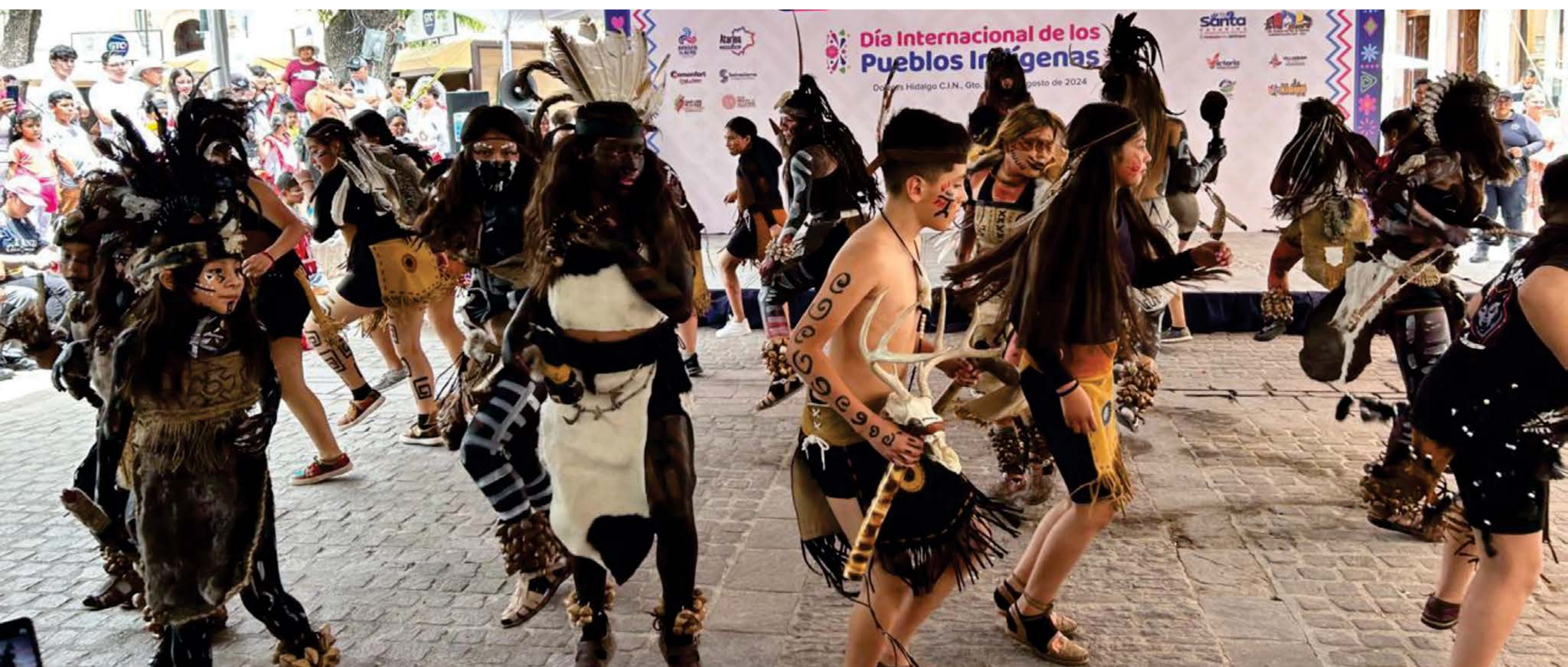
La danza como expresión artística de los pueblos indígenas

En el marco del Día Internacional de Pueblos Indígenas se realizó un evento en la ciudad de Dolores Hidalgo Cuna de la Independencia Nacional, con la participación de comunidades de diferentes partes del estado, en el que se presentaron muestras de su cultura a través de danzas, exposición de artesanías, muestra gastronómica y de medicina ancestral con una asistencia de más de 280 personas.