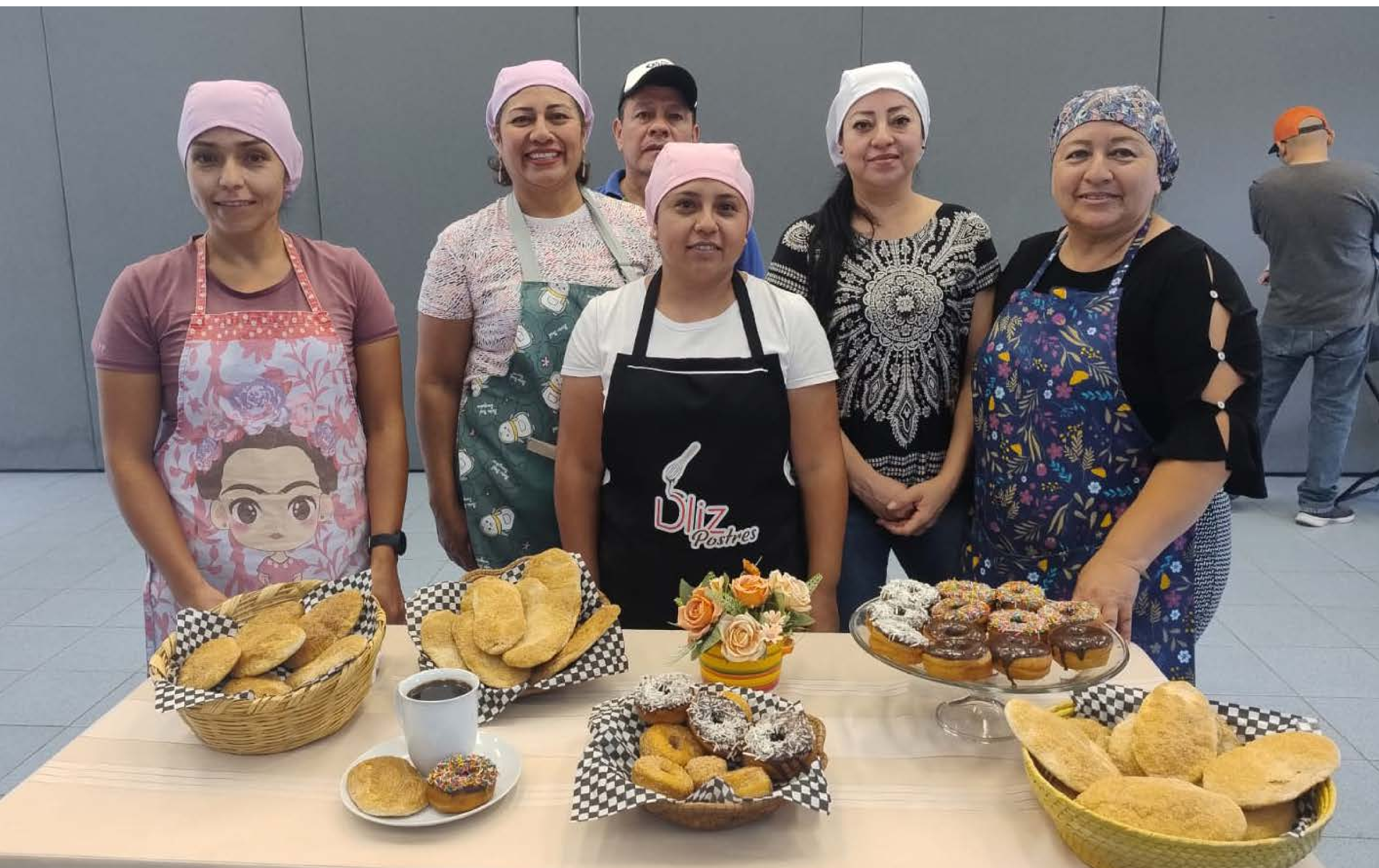
Alimentación de la gente

A través de cinco modalidades y una inversión de 614 millones 14 mil 178 pesos, damos la oportunidad para que logren un cambio de alimentación duradero.