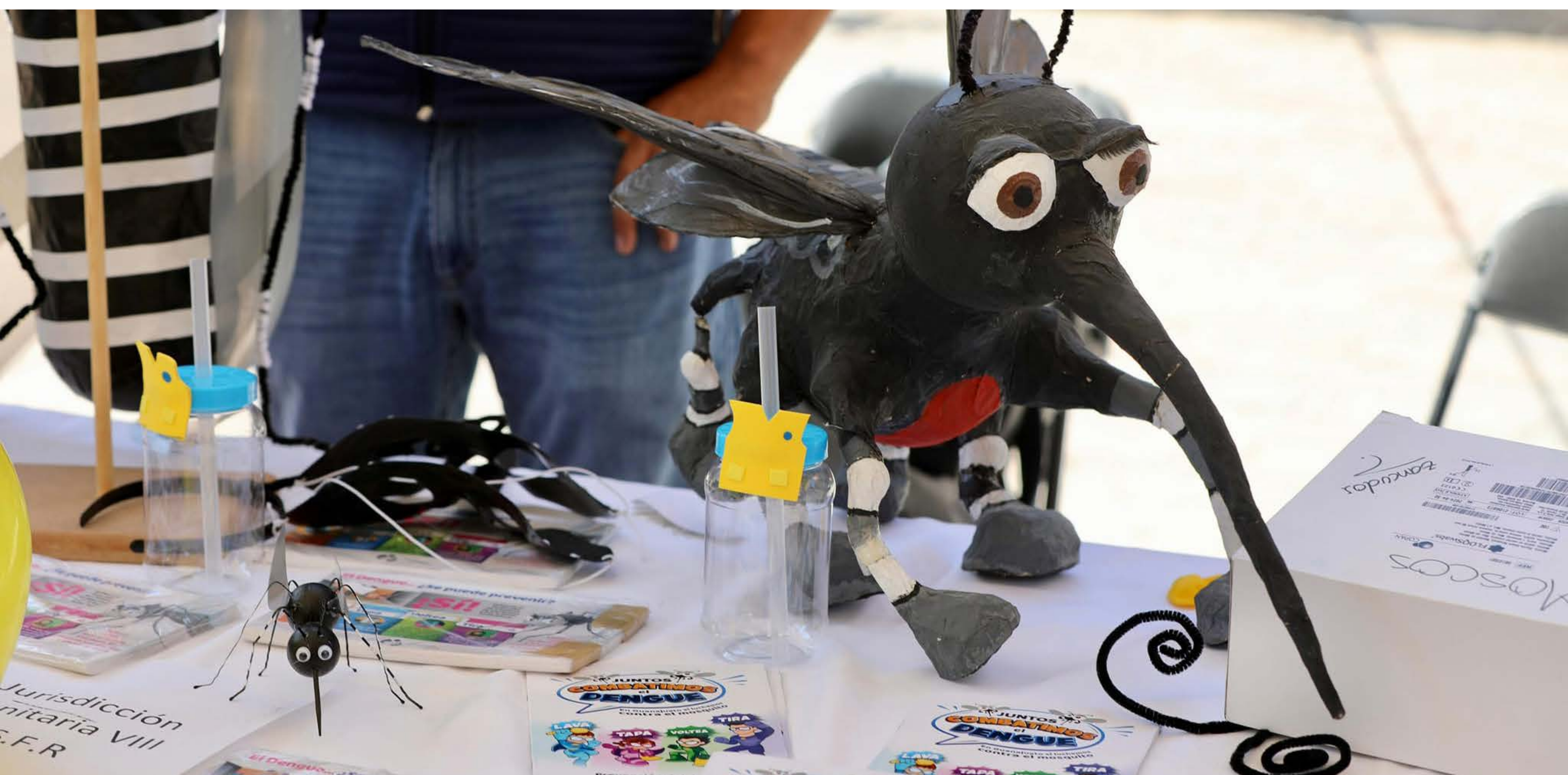
Realizamos acciones para evitar la propagación de enfermedades transmitidas por vector, como el dengue

Realizamos acciones para evitar la propagación de enfermedades transmitidas por vector. Gracias a ello, Guanajuato es uno de los estados con menor tasa de incidencia acumulada a nivel nacional en casos de dengue. Como parte de estos esfuerzos, llevamos a cabo 4 millones 388 mil 787 visitas a viviendas para identificar y eliminar los criaderos de moscos que transmiten estos padecimientos. En esta labor intervienen 1 mil 58 brigadistas que dan cobertura a los 46 municipios.