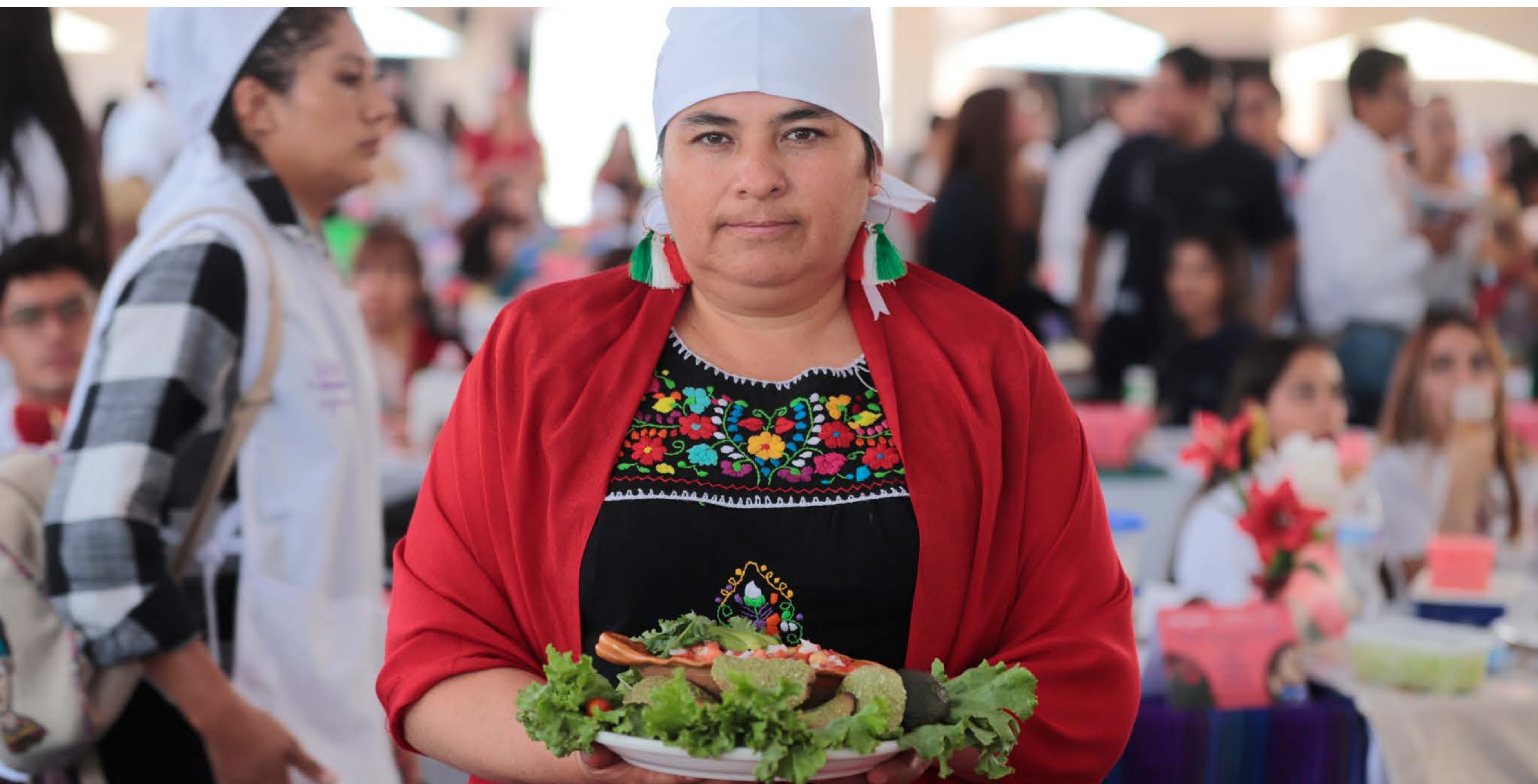
Alimentamos a Guanajuato, Sano Variado y Suficiente

Evitar la desintegración de una familia por distintos motivos como violencia, estrés, etcétera, es una prioridad para el Gobierno de la Gente; con esta idea, brindamos atención especializada a 53 núcleos familiares y mejoramos sus condiciones de vida.