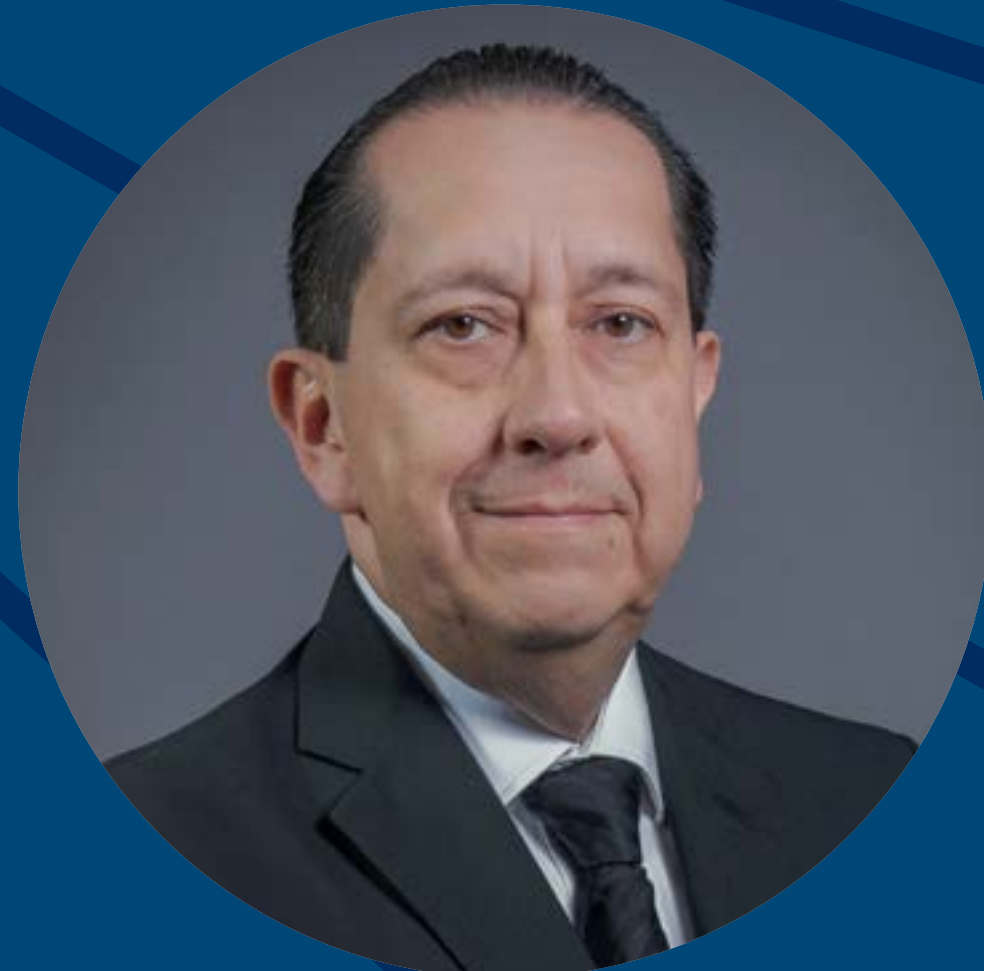
Gabriel Alfredo Cortés Alcalá Secretaría de Salud - Instituto de Salud Pública del Estado de Guanajuato