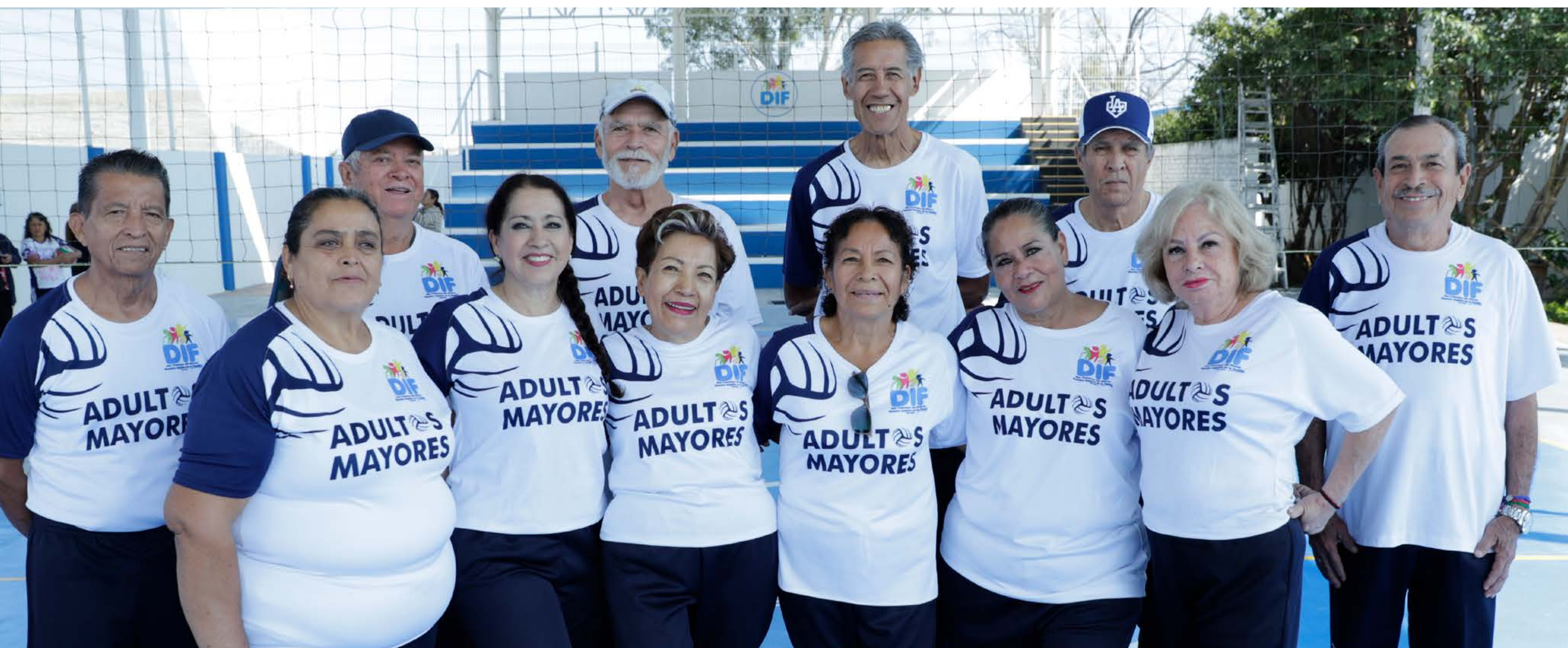
Promovemos la activación física y los buenos hábitos de nuestras Personas Adultas Mayores

Nuestras personas adultas mayores se divierten se mantienen sanos y activos gracias a la organización de torneos regionales y estatales de cachibol. En el periodo que se informa compitieron 1 mil 317 personas de los 46 municipios.