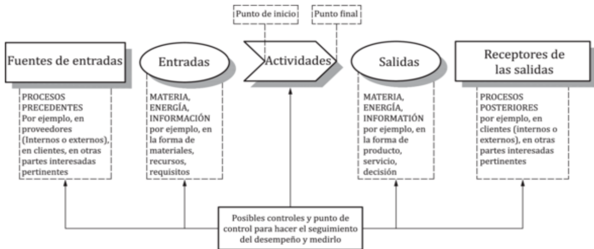
Imagen 1. Representación esquemática de los elementos de un proceso.